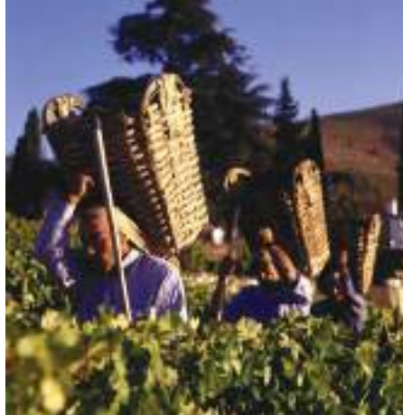
Vindimas no Douro

O Rio Douro flui da fronteira com Espanha para leste da cidade do Porto e, dependendo da altura do ano, as suas encostas podem estar decoradas com amendoeiras e cerejeiras em flor, ou com o labor das vindimas.