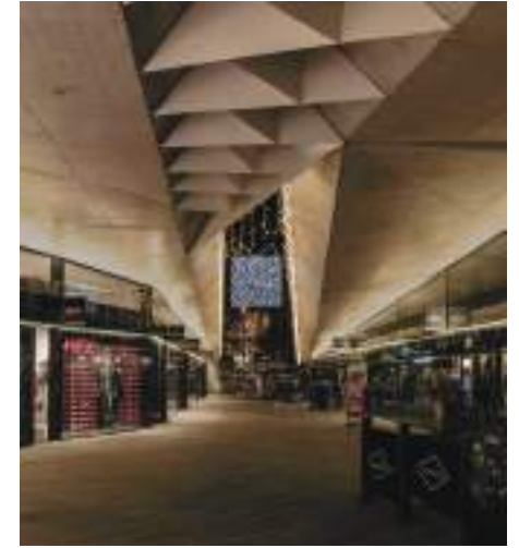
Passagem dos Clérigos – Porto