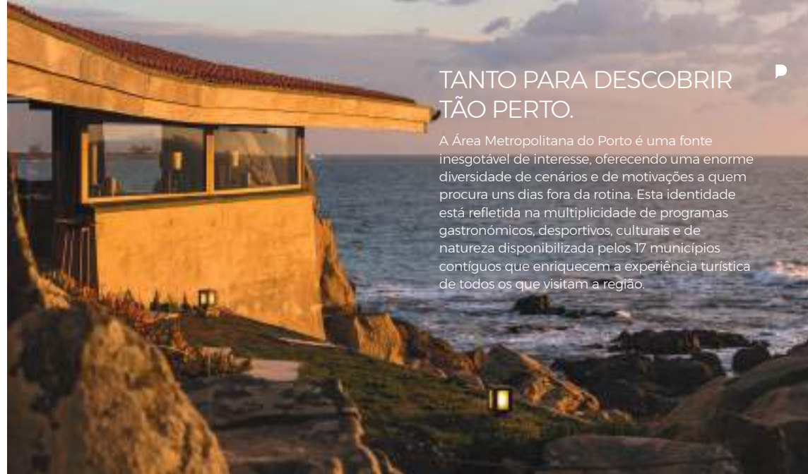
Casa de Chá da Boa Nova, Leça da Palmeira

No Porto e Norte de Portugal é sempre possível transformar um simples transfer num evento, tornando-o inesquecível a bordo de um barco, de um elétrico ou de um comboio.