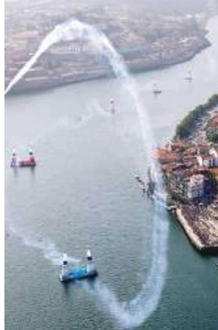
Red Bull Air Race, na Ribeira – Porto