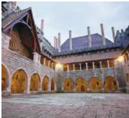
Paço dos Duques de Bragança – Guimarães