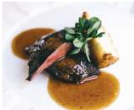
Paladares do Douro