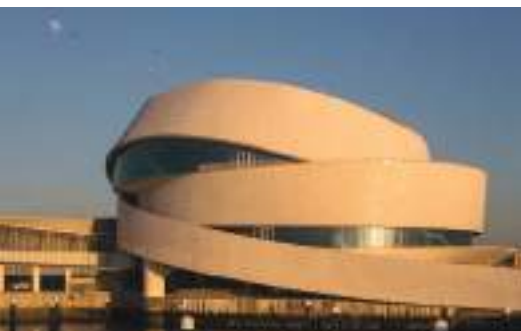
Terminal de Cruzeiros de Leixões