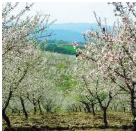
Amendoeiras em Flor