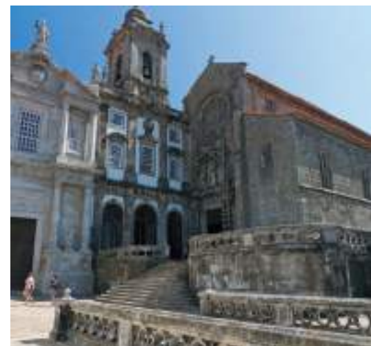
Igreja de São Francisco – Porto