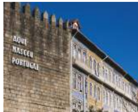
Castelo de Guimarães