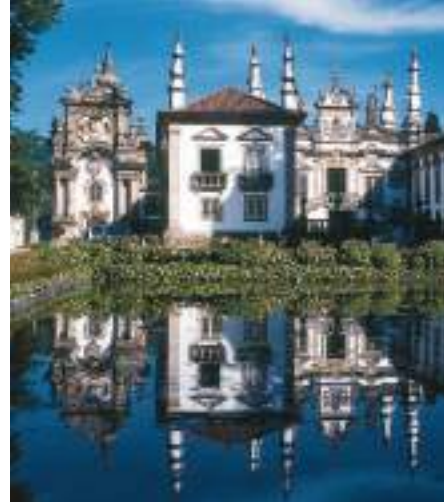
Fundação Casa de Mateus – Vila Real