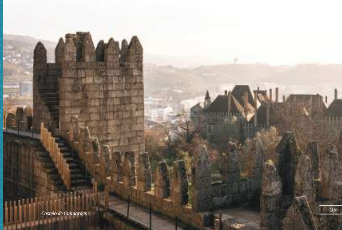
Castelo de Guimarães