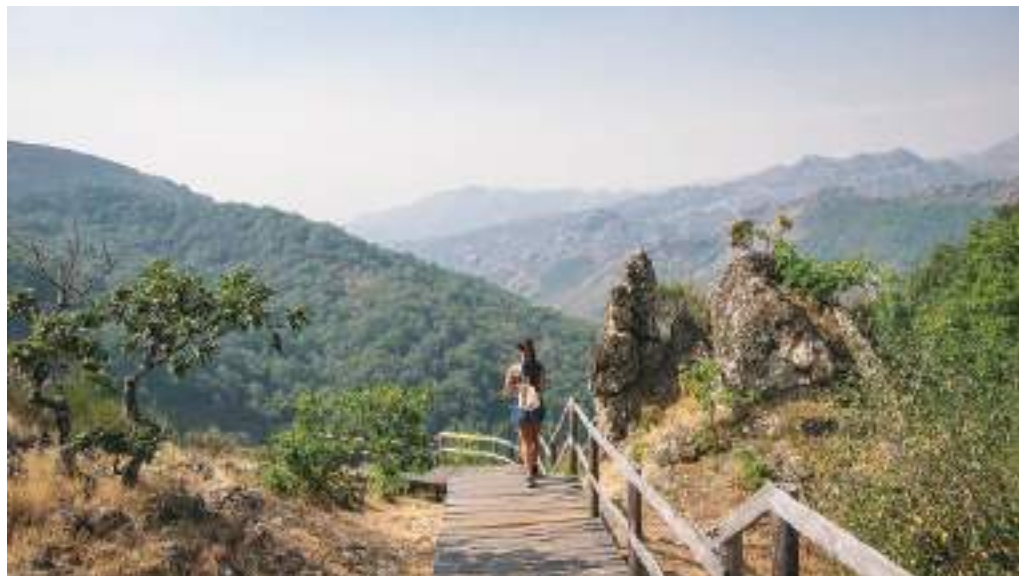
Parque Nacional da Peneda-Gerês