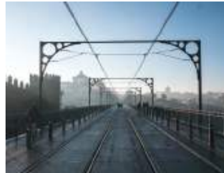
Ponte Luíz I – Porto