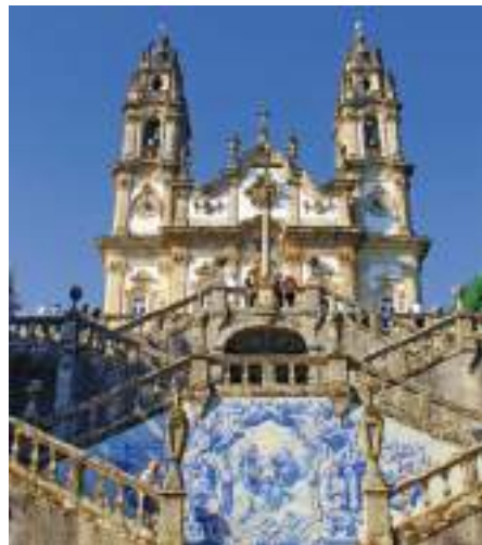
Santuário de Nossa Senhora dos Remédios – Lamego