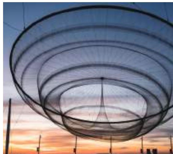
Praça Cidade S. Salvador, Matosinhos