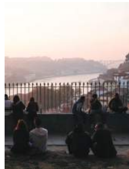
Jardim das Virtudes – Porto