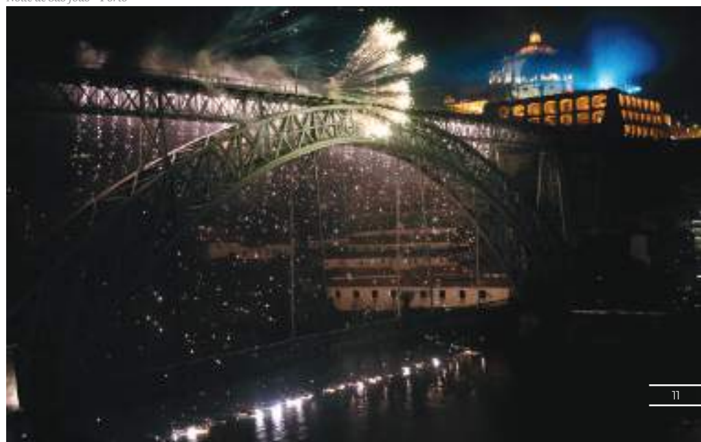
Noite de São João – Porto