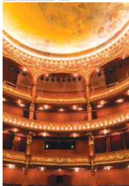
Teatro Nacional São João – Porto