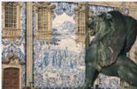
Praça de Gomes Teixeira – Porto

Percorrer a pé as suas ruas e sentir o pulsar da cidade é uma experiência única. O Porto é uma cidade de cultura e lazer fervilhantes, um local cosmopolita e contemporâneo, reconhecido como Best European Destination em 2012, 2014 e 2017. É imperdível fazer uma viagem de elétrico até à foz do rio Douro e aproveitar para conhecer as excelentes praias e esplanadas, visitar igrejas e monumentos e deparar-se com o modernismo inconformista dos novos edifícios contemporâneos de arquitetos como Siza Vieira, Souto de Moura ou Rem Koolhaas.