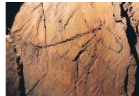
Arte Rupestre do Vale do Côa

Conhecer o Parque Natural do Douro Internacional e o Parque Natural do Alvão é igualmente sedutor. Situada na região do Alto Douro, Vila Nova de Foz Côa viu o seu nome correr fronteiras pela descoberta das suas gravuras rupestres paleolíticas ao ar livre. Hoje classificada como Património Mundial da Humanidade pela UNESCO é um dos maiores centros arqueológicos de arte rupestre da Europa.