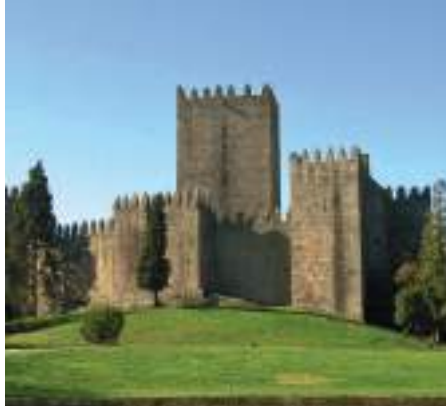
Castelo de Guimarães

Igrejas e monumentos de inigualável beleza seduzem o viajante, assim como uma cultura popular rica, música, folclore, histórias e artesanato. O Caminho Português de Santiago, percurso dos peregrinos que afluem a Santiago de Compostela desde o século IX, passa no Minho.