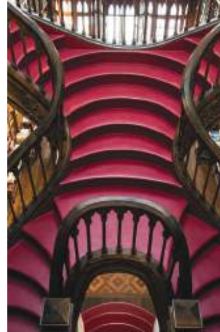
Livreria Lello – Porto