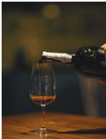
Prova de Vinho do Porto