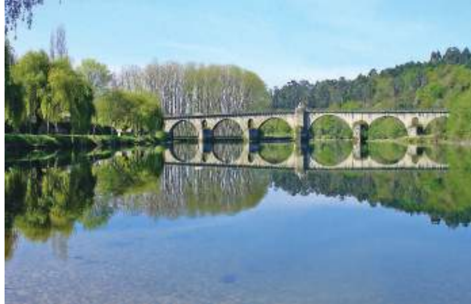
Ponte sobre o Lima – Ponte da Barca