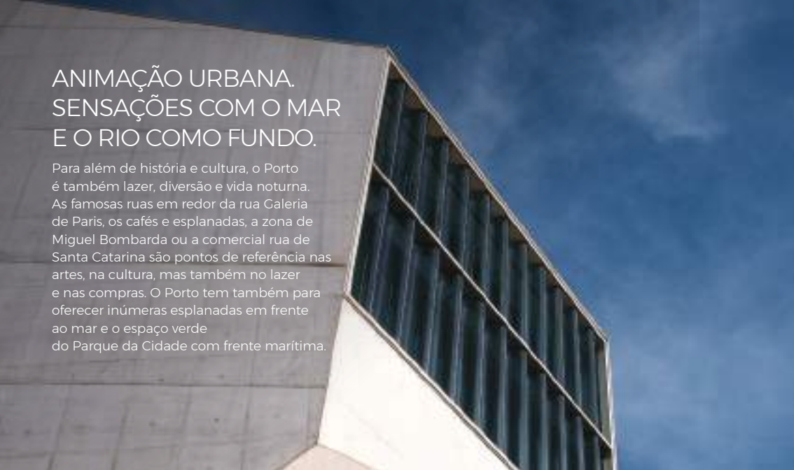
Casa da Música – Porto

Para além de história e cultura, o Porto é também lazer, diversão e vida noturna. As famosas ruas em redor da rua Galeria de Paris, os cafés e esplanadas, a zona de Miguel Bombarda ou a comercial rua de Santa Catarina são pontos de referência nas artes, na cultura, mas também no lazer e nas compras. O Porto tem também para oferecer inúmeras esplanadas em frente ao mar e o espaço verde do Parque da Cidade com frente marítima.