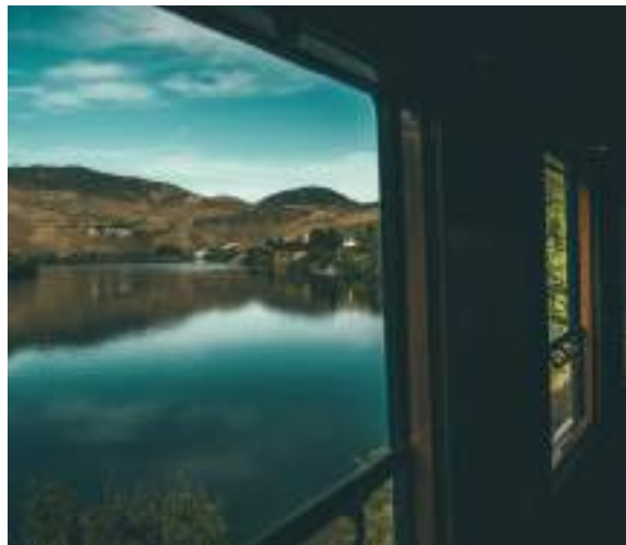
Comboio Histórico no Vale do Douro

É fundamental experimentar as receitas tradicionais acompanhadas dos conceituados vinhos, nas quintas ou nos excelentes restaurantes locais. A vindima, as lagaradas e outros eventos de cariz tradicional são igualmente ímpares. Fazer um cruzeiro no rio Douro, num dos muitos barcos disponíveis, e admirar as suas escarpas é uma das atividades mais apreciadas por quem visita a região. Viajar de comboio e desfrutar da paisagem é uma experiência igualmente inesquecível. As atividades radicais são muitas e existe uma variedade de desportos aquáticos de rio que se podem praticar. O Btt, os raides off road 4x4 e os passeios de helicóptero complementam uma vasta oferta de formas de desfrutar o Douro.