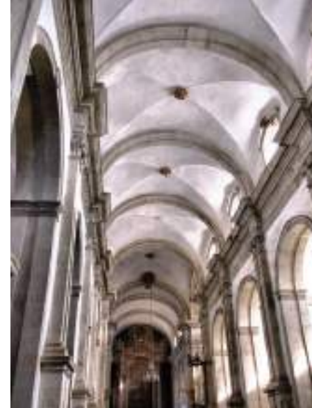
Mosteiro de Salzedas – Tarouca