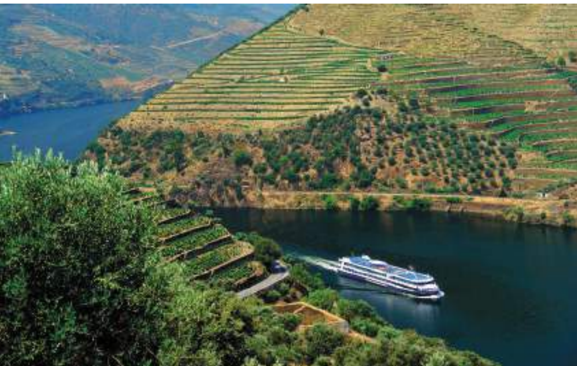
Vale do Douro