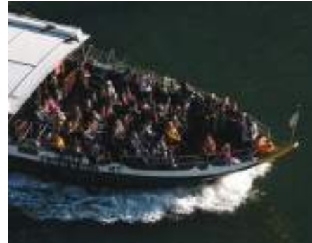
Passagem de Barco Rabelo