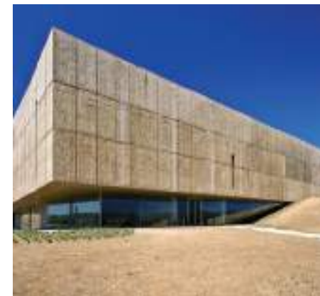
Museu do Côa – Vila Nova de Foz Côa