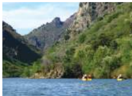
Kayak no Douro