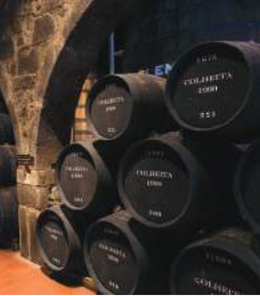
Caves de Vinho do Porto – VN Gaia