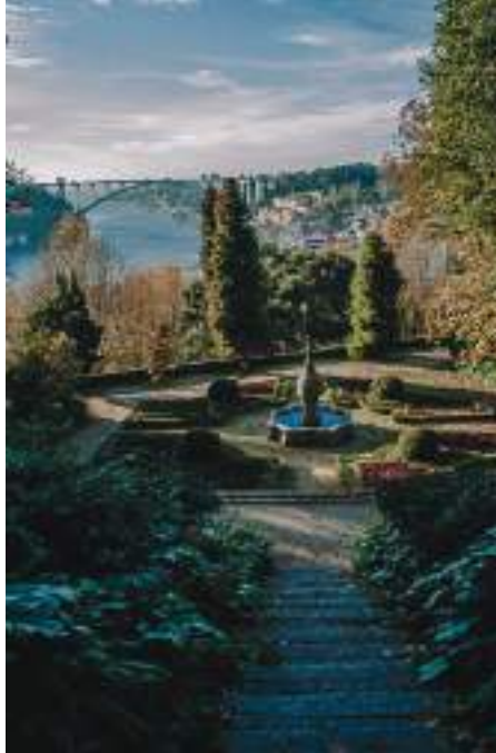
Jardins do Palácio de Cristal – Porto

A Casa do Infante, a igreja Monumento de São Francisco de Assis, o Palácio da Bolsa, a marginal ribeirinha e as bem preservadas ruas da Ribeira e de Miragaia são também recomendáveis. A modernidade da Casa da Música e do Museu de Arte Contemporânea de Serralves complementam a visita.