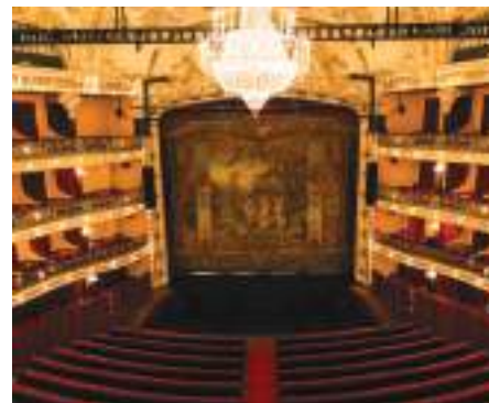
Teatro Círculo – Braga