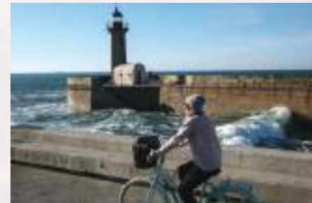
Foz do Douro – Porto