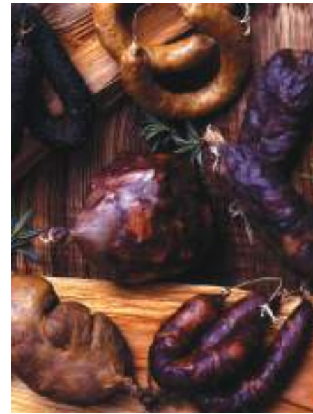
Fumeiro Tradicional – Vinhais

Trás-os-Montes é uma zona rica e peculiar no que respeita a gastronomia, com destaque para o azeite de puríssima qualidade e a alheira, um enchido típico muito apreciado oriundo da zona de Miranda. As celebrações do Entrudo em Trás-os-Montes são vibrantes e plenas de tradição. Os festejos prolongam-se durante os dias que antecedem a Quarta-feira de Cinzas, e incluem trajes vistosos, desfiles animados e música tradicional, atraindo visitantes de todo o mundo. Termas revigorantes e natureza selvagem são predicações de uma zona muito preservada, dona de uma beleza admirável.