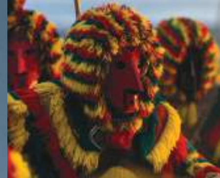
Caretos de Podence

Nas cidades e vilas do Norte de Portugal o visitante encontrará um pouco de tudo. Cidades como o inimitável Porto, a distinta Braga ou Guimarães, onde nasceu Portugal. É também imprescindível conhecer Viana do Castelo, Ponte de Lima, Bragança, Chaves, Amarante, Lamego ou Vila Real. Locais de grande interesse patrimonial e histórico, de cultura e de um modo de viver próprio e acolhedor.