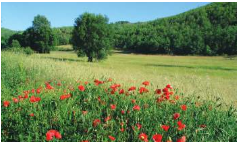
Parque Natural de Montesinho