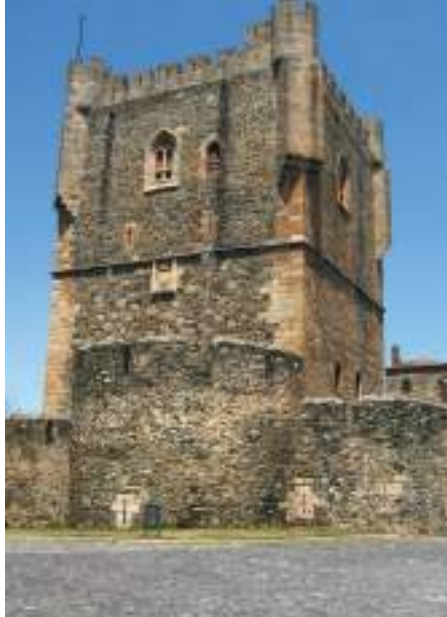
Torre de Menagem – Bragança

Bonitas cidades como Chaves, Bragança, Miranda do Douro ou locais como Vidago, Montalegre ou Macedo de Cavaleiros merecem uma visita prolongada. Esta região remota e montanhosa, proclamada reino maravilhoso pelo escritor Miguel Torga, oferece cenários únicos, como são as amendoeiras em flor, vilas históricas, paisagens naturais e uma gastronomia riquíssima. Bragança e o seu núcleo histórico estão situados no extremo do Parque Natural de Montesinho - uma das zonas florestais mais selvagens da Europa, com uma enorme diversidade de flora e fauna, onde são preservadas espécies como o lobo ibérico, o veado, a raposa e o javali.