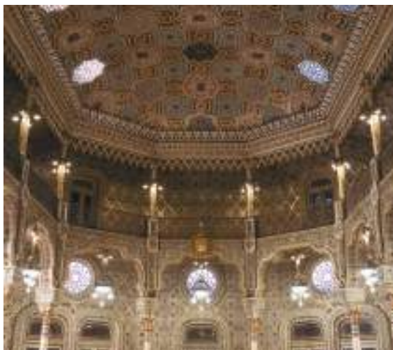
Palácio da Bolsa – Porto