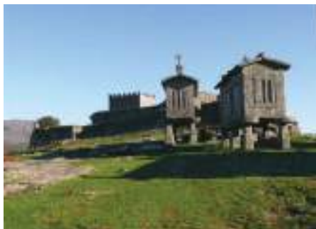
Castelo Lindoso – Ponte da Barca