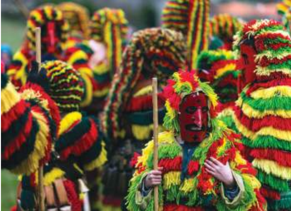
Caretos de Podence