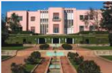
Fundação de Serralves – Porto