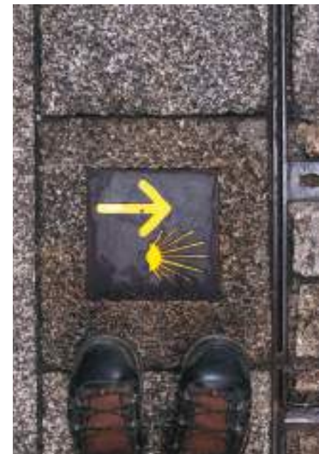
Caminho Português de Santiago