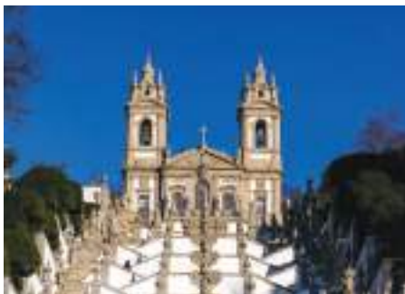
Igreja do Bom Jesus – Braga