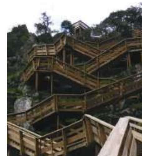
Passadiços do Paiva, Arouca