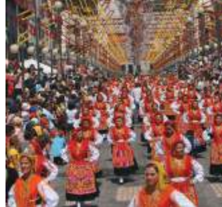
Festas de Nossa Senhora da Agonia – Viana do Castelo