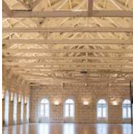
Centro de Congressos da Alfândega do Porto