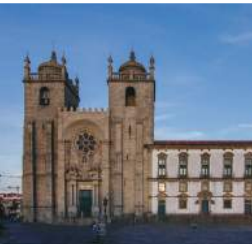
Sé Catedral – Porto