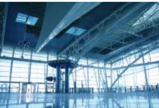
Aeroporto Internacional do Porto

As ligações aéreas, marítimas e terrestres que unem o Porto às principais cidades europeias são de grande qualidade. Desde os premiados Aeroporto Francisco Sá Carneiro e o Terminal de Cruzeiros de Leixões, passando pelas aptas redes rodoviária e ferroviária, tudo contribui para que a cidade tenha uma excelente relação com o exterior e com os seus visitantes.