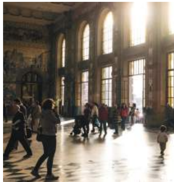
Estação de S. Bento – Porto