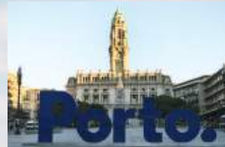
Câmara Municipal do Porto