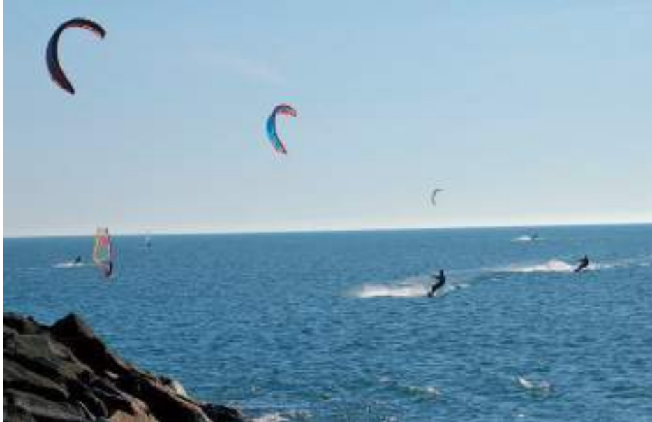
Kitesurfing – Praia do Cabedelo, Viana do Castelo