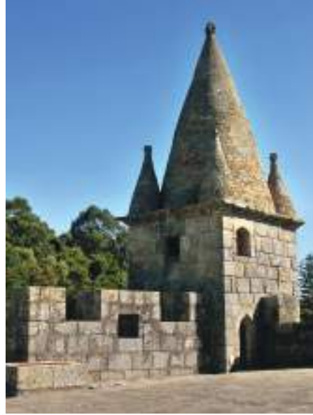
Castelo de Santa Maria da Feira