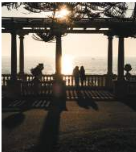
Pêrgula da Foz – Porto