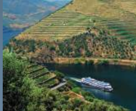
Vale do Douro