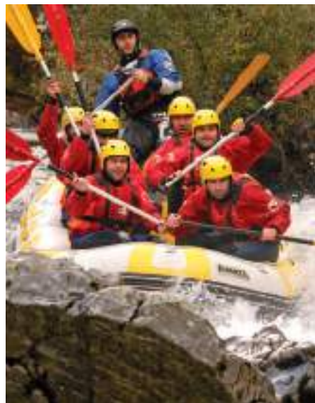
Rafting no Gerês

A orla marítima tem inúmeras praias, montanhas verdejantes, casas senhoriais, monumentos e obras-primas da arquitetura tradicional e contemporânea, festivais, artesanato, gastronomia e o excelente Vinho Verde.