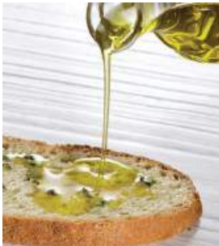
Azeite de Trás-os-Montes DOP

A vida quotidiana não sofreu muitas alterações durante séculos e as aldeias e vilas mais isoladas possuem uma beleza rústica muito própria. Os habitantes têm ainda um modo de vida muito ligado às tradições. É especialmente fascinante visitar locais como Miranda do Douro, Mogadouro, Torre de Moncorvo e Freixo de Espada à Cinta. Os costumes e o misticismo estão aqui muito presentes, a começar pela Lhéngua mirandesa, a enigmática lenda da ponte de Mizarela em Montalegre e a celebração da sexta-feira 13, o evento de medicina popular de Vilar de Perdizes, a feira de fumeiro de Vinhais ou os célebres Caretos de Podence.